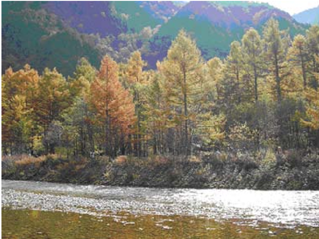
( 秋の上高地 )