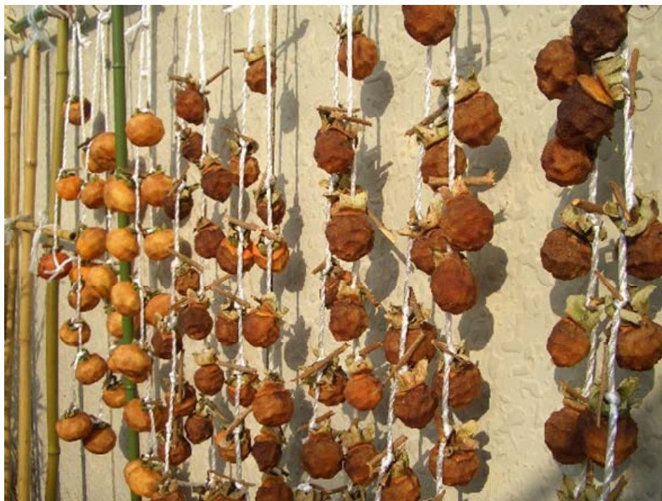
( 干し柿 )