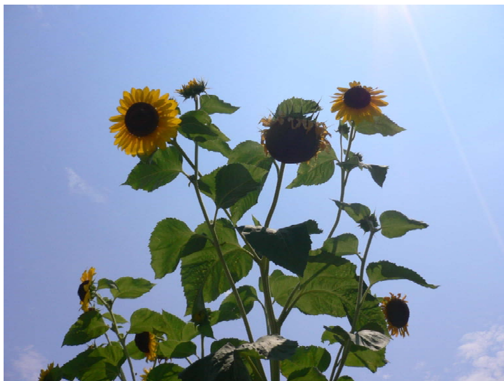
( 猛暑の中の向日葵 )