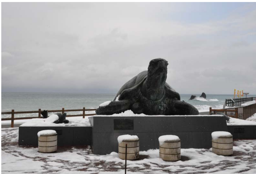
(親不知ピアパーク)