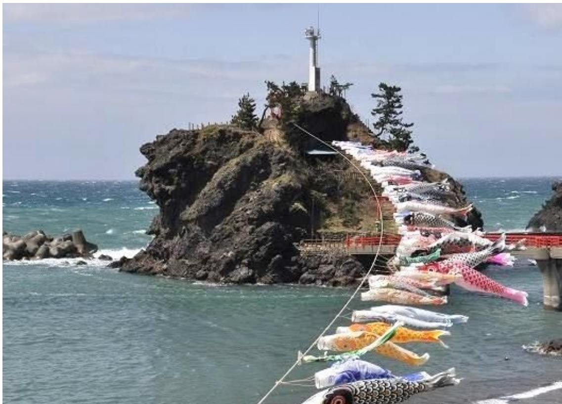
( こいのぼり )